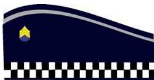
Gorro sem pala para Guarda Civil Metropolitano

Descrição : Com um filete em linha metalizada prateada, com 2 mm de largura. Do lado esquerdo deverá ser colocada insígnia em miniatura de metal em suas cores originais, ou bordada em linha metalizada de cor amarelo-ouro Pantone: 7406 C, referente à graduação ocupada, centralizada e horizontalmente a 30 mm da parte frontal.