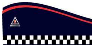
Gorro sem pala para Subinspetor e Classe Distinta

Descrição : Com um filete vermelho Pantone: 191763 TC, com 2 mm de largura. Do lado esquerdo deverá ser colocada insígnia em miniatura de metal em suas cores originais, ou bordada em linha metalizada prateada, referente à graduação ocupada, centralizada e horizontalmente a 30 mm da parte frontal.