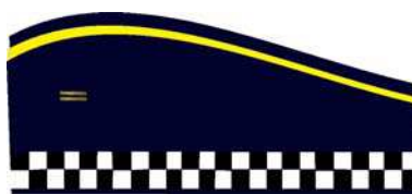
Gorro sem pala para Inspetor

Descrição : Com um filete dourado, com 2 mm de largura. Do lado esquerdo deverá ser colocada insígnia em miniatura de metal em suas cores originais ou bordada em linha metálica dourada, referente ao cargo de Inspetor, centralizada e horizontalmente a 30 mm da parte frontal.